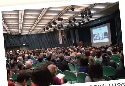
かみ合わせ無料公開講座 去る2020年1月26日 梅田/オーバルホールにて開催